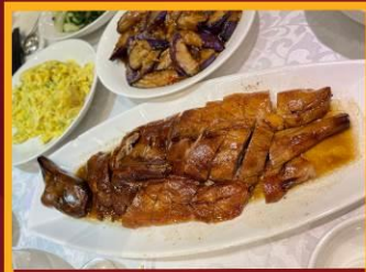
ท่านย่าง