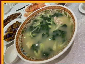
ซุปลวกใส่หมู