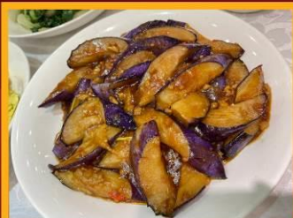
มะเขืออบหม้อดิน