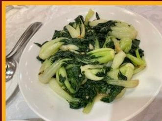
ผักต้มตามฤดูกาล