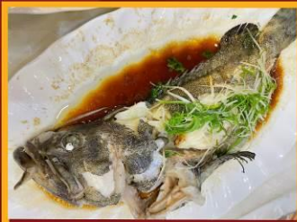
ปลาหนึ่งซีอิ้ว