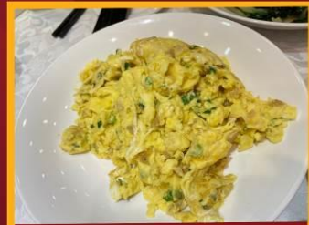
ไข่เจียวทรงเครื่อง