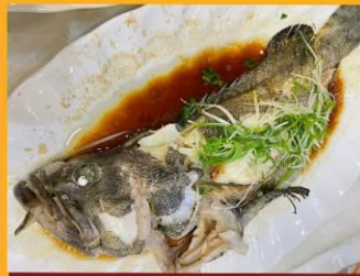
ปลาหนึ่งซีอิ้ว