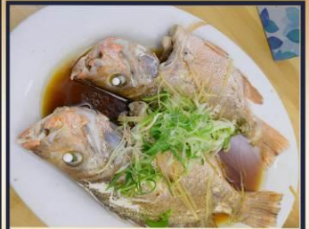
ปลาหนึ่งซีอิว