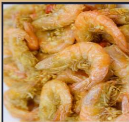
กุ้งทอดกระเทียม