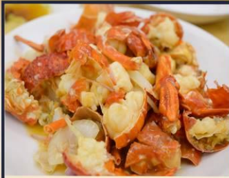
กุ้งมังกรอบซีส