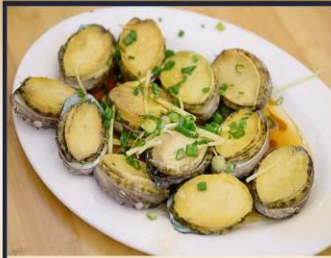
เปาอี้อสดหนึ่ง