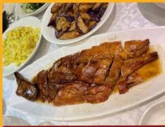
ท่านอย่าง