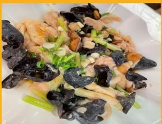
ไก่ผัดเห็ดหูหนู