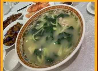
ซุปรังไก่สมุนไพร